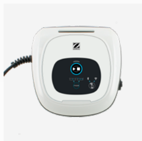
Unidad de control