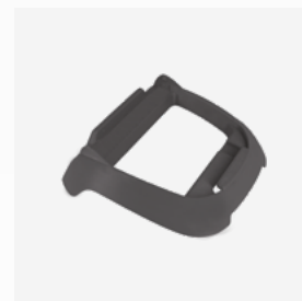
Base para unidad de control